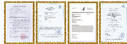
CFDA认证 欧盟CE认证 美国FDA认证 13485体系认证

铂晶瓷·钻石全瓷牙选用进口原料精工制造，现已通过欧盟CE、美国FDA、中国CFDA、医疗器械13485等权威机构认证。